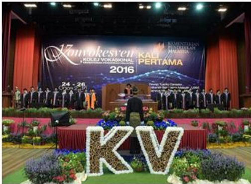
24-26 Ogos 2016 Universiti Sains Islam Malaysia